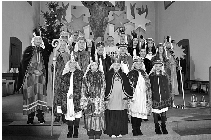
Sternsingergruppe Ortsteil Gissigheim