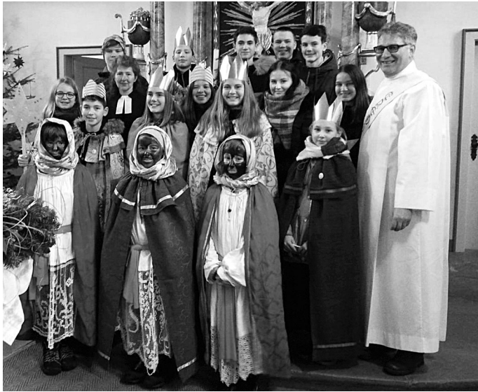
Sternsingergruppe Ortsteil Brehmen