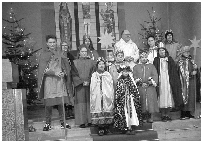
Sternsingergruppe Ortsteil Pülfringen