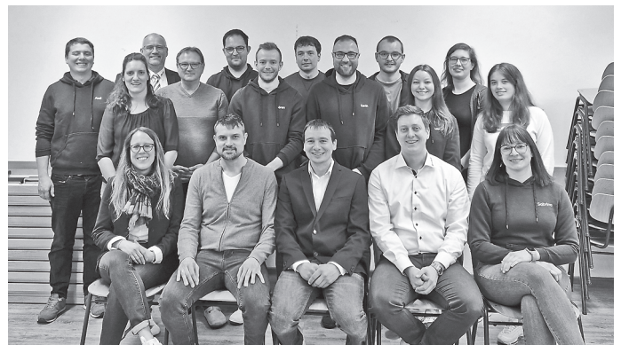
Das Bild zeigt die aktuelle Vorstandschaft.

Ehrungen und Neuwahlen standen in diesem Jahr nicht auf der Tagesordnung.